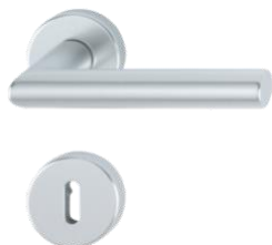
Poignée HOPPE modèle AMSTERDAM - en aluminium sur rosaces