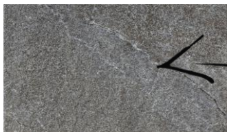
Faïence ROXSTONES – DARKQUARTZ