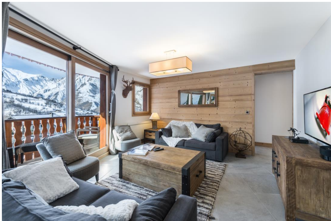
Carrelage URBATEK – DEEP LIGHT GREY