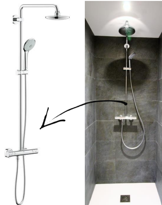
GROHE – Douche Euphoria System 180