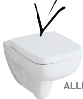
ALLIA - PRIMA STYLE